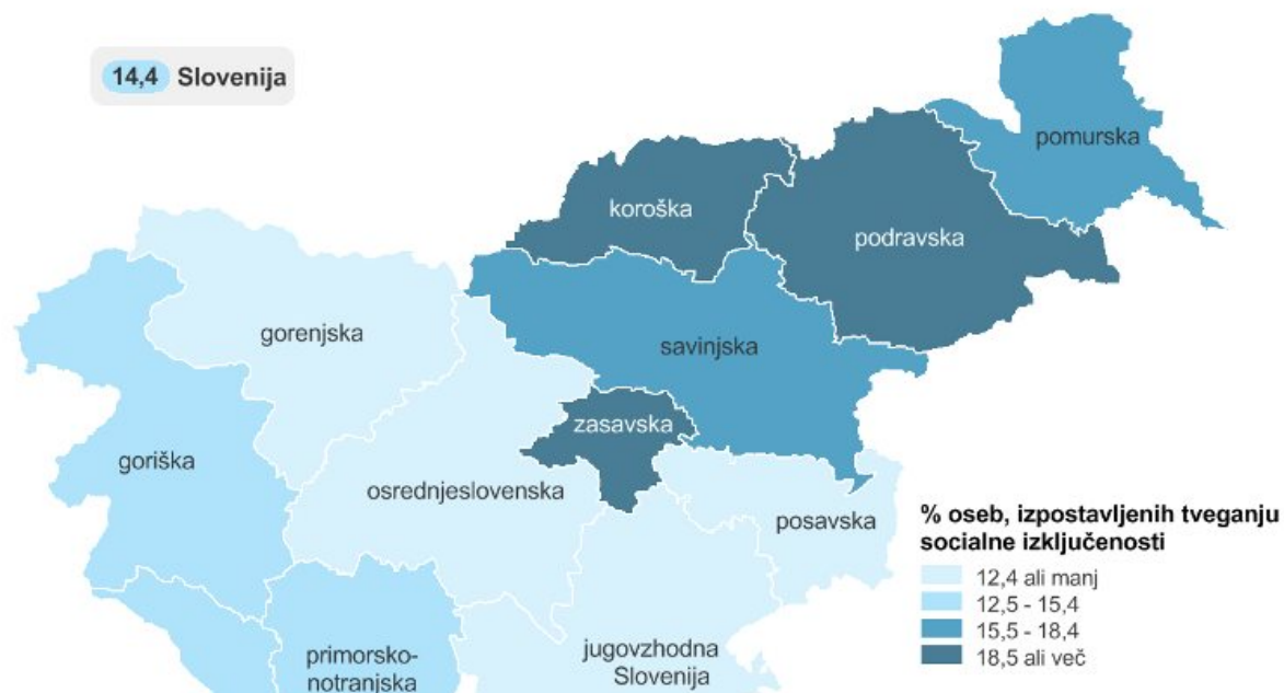
Stopnja tveganja socialne izključenosti, statistične regije, Slovenija, 2019

Za 0,2 odstotne točke se je znižal tudi delež oseb, ki so bile hkrati izpostavljene vsem trem oblikam socialne izključenosti. Teh najranljivejših oseb je bilo v letu 2019 približno 10.000, to je 4.000 manj kot v letu 2018.