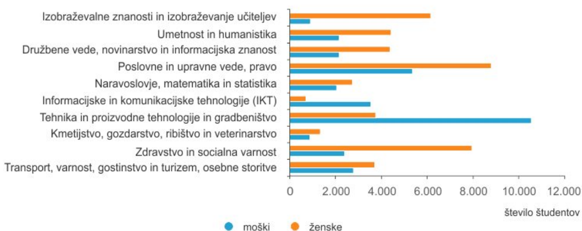
Študenti terciarnega izobraževanja po področju izobraževanja (KLASIUS-P-16) in spolu, Slovenija, študijsko leto 2019/20

V študijskem letu 2019/20 je bilo največ študentov vpisanih v študijske programe s področja tehnika, proizvodne tehnologije in gradbeništvo (18,6 %), področja poslovne in upravne vede, pravo (18,5 %) ter področja zdravstvo in socialna varnost (13,5 %). Najmanj študentov študira na področju kmetijstvo, gozdarstvo, ribištvo in veterinarstvo (2,9 %) ter področju informacijske in komunikacijske tehnologije (5,6 %).