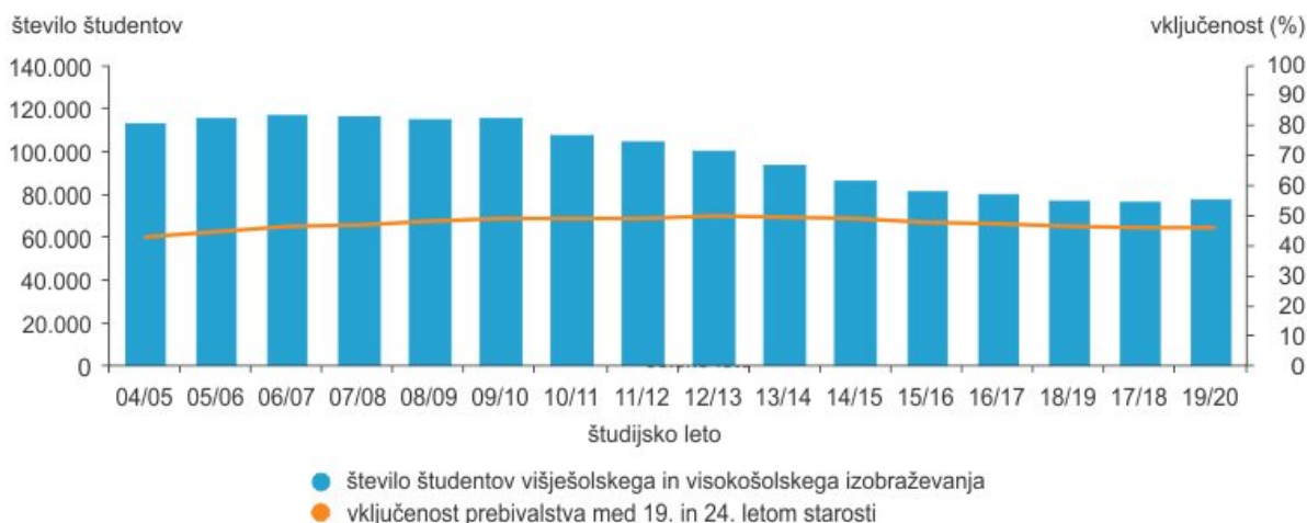
Študenti terciarnega izobraževanja ter vključenost prebivalstva, starega od 19 do 24 let, v terciarno izobraževanje, Slovenija

V študijskem letu 2019/20 je bilo v terciarno izobraževanje vpisanih 76.728 študentov, 1 % več kot v prejšnjem študijskem letu. Zadnjih devet let je število študentov vztrajno padalo, v povprečju za več kot 4.320 na študijsko leto. Lani je bilo študentov 75.991, kar je skoraj 39.000 manj kot pred desetimi leti. V letošnjem študijskem letu pa je bilo študentov spet več kot prejšnje leto. Število študentov je najopazneje zraslo med doktorskimi študenti (za 7 %) in študenti visokošolskega strokovnega izobraževanja (za 3,2 %).