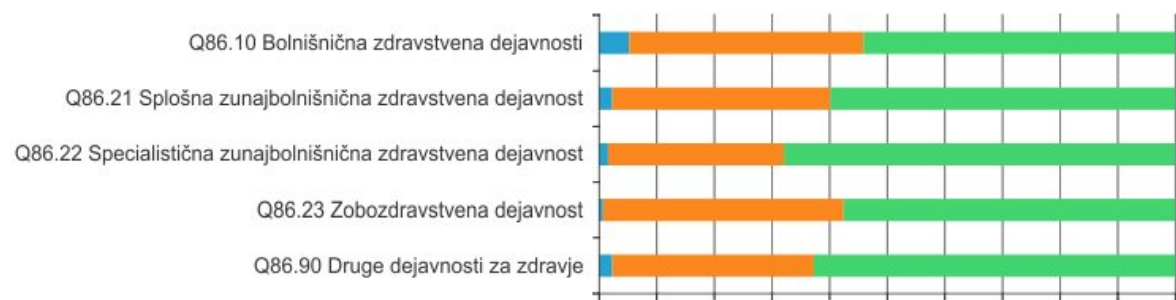
Delež delovno aktivnih oseb v dejavnosti zdravstvo po doseženi izobrazbi, Slovenija, 31. 7. 2019

V bolnišnični zdravstveni dejavnosti je delalo nekaj več kot 25.700 delovno aktivnih oseb ali 57,3 % vseh v dejavnosti zdravstvo. Nekaj manj kot 11.700 ali 26,0 % delovno aktivnih oseb je delalo v splošni zunajbolnišnični zdravstveni dejavnosti, nekaj manj kot 2.400 ali 5,3 % v specialistični zunajbolnišnični zdravstveni dejavnosti, nekaj manj kot 2.300 ali 5,0 % v zobozdravstveni dejavnosti in skoraj 2.900 ali 6,4 % v drugih dejavnostih za zdravje.