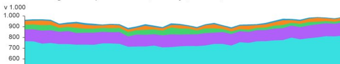
Delovno aktivni glede na zaposlitveni status, Slovenija, četrtnetu, 2010–2019

Podrobneje smo pogledali gibanje števila delovno aktivnih glede na zaposlitveni status od leta 2010 do 2. četrtnetu 2019. Zaposlenih v delovnem razmerju je po zadnjih podatkih (za 2. četrtnetu 2019) 813.000 ali za 3,2 % (25.000) več, kot jih je bilo v 2. četrtnetu 2018; njihovo število narašča vse od leta 2014. Številčno sledijo samozaposleni ; teh je bilo 126.000 ali za 2,5 % (3.000) več, kot jih je bilo v 2. četrtnetu 2018. Število samozaposlenih se od leta 2010 giblje podobno kot število zaposlenih v delovnem razmerju. Preostali delovno aktivni so delo opravljali prek študentskega servisa (26.000), bili zaposleni v drugih oblikah dela (6.000) ali pa so delali kot pomagajoči družinski člani (20.000).