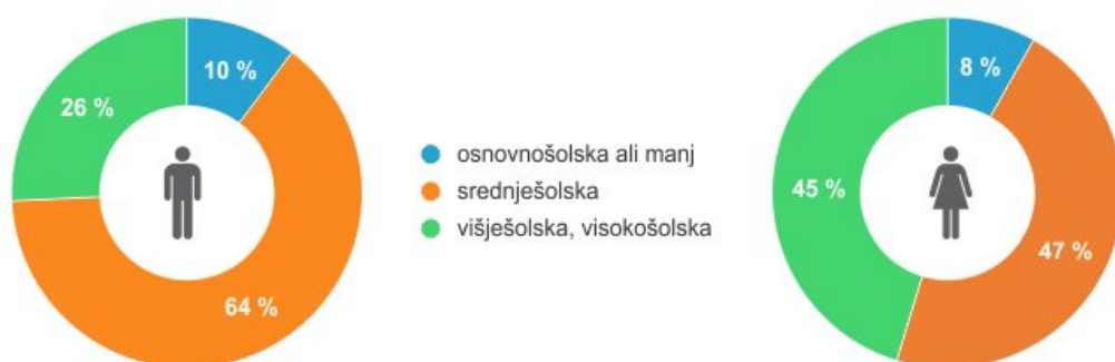
Delež delovno aktivnih oseb po doseženi izobrazbi in spolu, Slovenija, 2018

Konec leta 2018 je imelo največ delovno aktivnih oseb srednješolsko izobrazbo: 64,0 % delovno aktivnih moških in 46,5 % delovno aktivnih žensk. Višje- ali visokošolsko izobrazbo je imelo 25,7 % delovno aktivnih moških (ali približno 125.600) in 45,3 % delovno aktivnih žensk (ali 181.000).