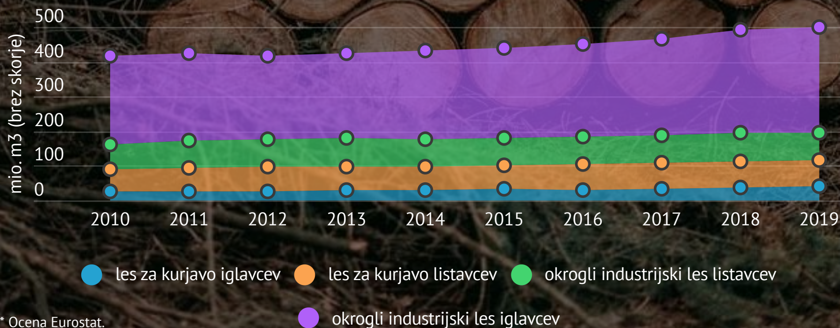
Proizvodnja okroglega lesa*, EU-27

Okrogli les je surovina za lesnopredelovalne dejavnosti (za proizvodnjo žaganega lesa, furnirja ter za proizvodnjo celuloze in papirja), kot les za kurjavo pa je pomemben obnovljivi vir energije. Skupna proizvodnja okroglega lesa na ravni EU-27 se je med letoma 2010 in 2019 povečala. V 2019 je bila ocenjena na 500 milijonov m 3 . Okrogli industrijski les iglavcev je pomenil 61 % skupne proizvodnje, okrogli industrijski les listavcev 16 %, les za kurjavo listavcev 15 %, les za kurjavo iglavcev pa 8 %.